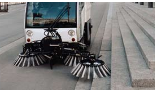
Allseitig steuerbarer Frontbesen

Mit dem durchdachten Besenkonzept werden schwer zugängliche Nischen und überdeckte Flächen problemlos erreicht und die genaue Ansteuerung ist ein Kinderspiel. Der Frontbesen passt sich automatisch engsten Gegebenheiten an und gewährleistet dadurch effizientes Arbeiten. Er kann mit den hydraulischen Hebe- und Neigevorrichtungen vielfältigen Bodensituationen angepasst werden und auch gestufte Areale und abgesenkte Rinnen sind auf diese Weise leicht zu bearbeiten.