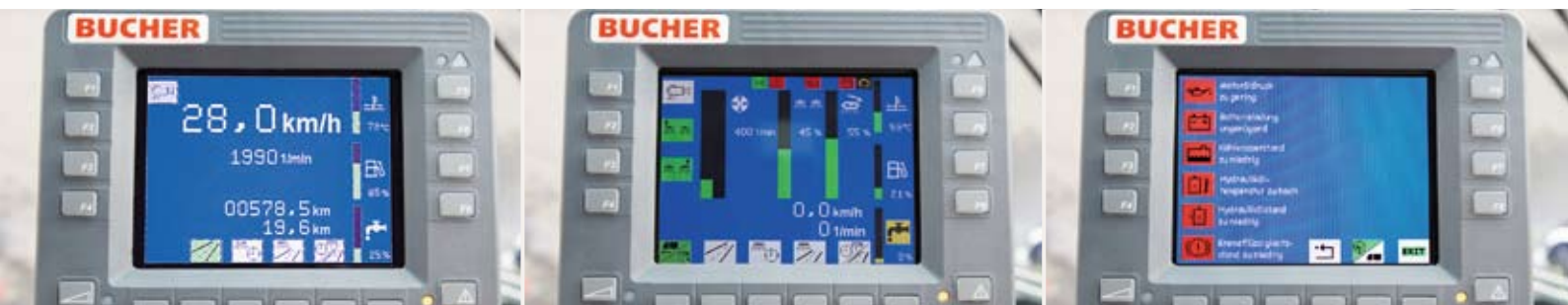
PSS, eine Bucher Schörling-Exklusivität

Der Kabininnenraum entspricht allen Anforderungen eines modernen Arbeitsplatzes. Des Weiteren verlaufen keine Hydraulikschläuche im Kabininnenraum, was eine bedeutende Reduktion der Geräusch- und Wärmeentwicklung im Innenraum bedeutet.