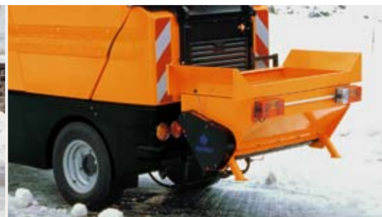
Schneekehrwalze und Walzenstreuer

Für das Beseitigen von Schnee auf schmalen Straßen und Gehsteigen ist das Schneeräumschild bestens geeignet.