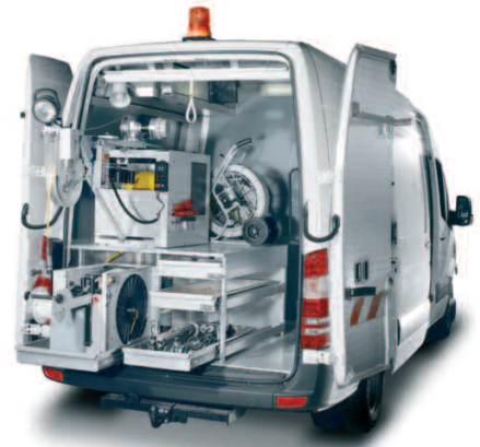
Geräteraum mit viel Platz für kundenspezifische Ausstattungswünsche