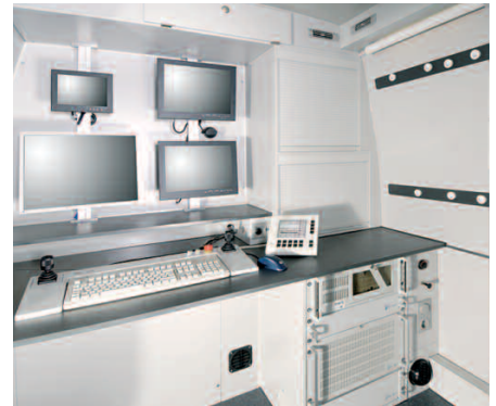
TOP-LINE Beobachtungsraum mit hochwertigen Ausbaumaterialien und übersichtlicher Arbeitsplatzanordnung